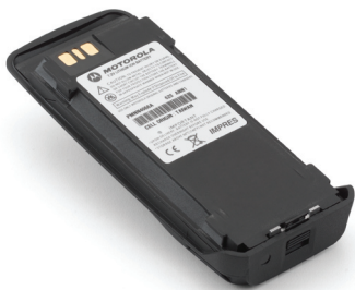
PMNN4066 Batería IMPRES 7.2V Lilon

Motorola presenta el concepto de mantenimiento inteligente y automatizado de baterías con el Sistema de Energía Inteligente IMPRES para baterías y cargadores. Esta exclusiva tecnología de Motorola permite a las organizaciones mantener las baterías de sus radios de dos vías funcionando de manera óptima. Diseñado y probado para operar en condiciones extremas durante todo un turno de trabajo, con la capacidad y seguridad que ofrece una batería de alta carga, el Sistema de Energía Inteligente IMPRES impulsa la productividad de la fuerza de trabajo y la eficiencia organizacional.