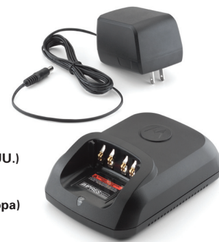
WPLN4232 Cargador IMPRES unitario (EE.UU.)

El Sistema de Energía Inteligente IMPRES de Motorola ofrece la confiabilidad y desempeño óptimo necesarios para la misión del personal de tareas críticas. A través del poder de innovación y de una interfaz inteligente de comunicación, el Sistema de Energía Inteligente cumple con el desafío del mantenimiento automático de la batería, a la vez que disminuye los efectos de memoria de la carga y optimiza el ciclo de vida de la batería. El manejo de la batería inteligente con el sistema IMPRES permite que el personal mantenga una comunicación de dos vías confiable mientras se encuentran en el campo, durante todo su turno de trabajo, con la tranquilidad de que el equipo operará normalmente aún en escenarios difíciles.